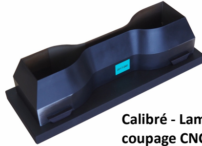
Calibré - Lame pour coupage CNC